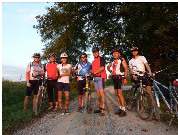
ZAPISAL: Sandi Lavrič

vodja poti- Sandi Lavrič, pomočnik- Primož Štrekelj, fotograf- Mojca Brkinjač, pomočnik fotografa- Drago Brkinjač, najmlajši udeleženec- Špela Brkinjač, najstarejši udeleženec- Slaviček